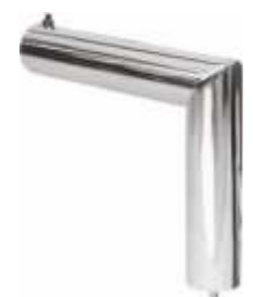
2109 Fixador parede superior para coluna 2902A Diâmetro: 60 mm Acabamento: CR