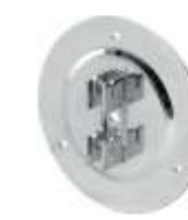
2104A Fixador parede Diâmetro: 120 mm Acabamento: CR