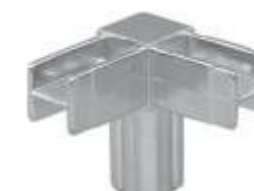
Q.03 - QUADRA Conector com 3 vias Acabamento: CR