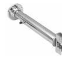
2045A Fixador parede telescópico Comprimento: de 180 ate 290 mm Diâmetro: 28 mm Acabamento: CR