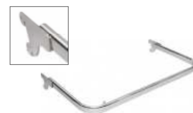
2240A Suporte em tubo para pendurados Comprimento: 900 mm Acabamento: CR