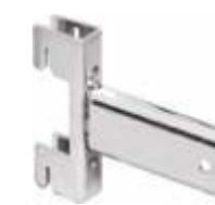
2103A Suporte para tubo oval 4000L 30 x 15 mm Acabamento: CR