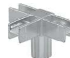
Q.04 - QUADRA Conector com 4 vias Acabamento: CR