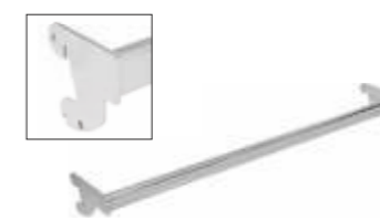
2246A Suporte em tubo para pendurados aderido Comprimento: 900 mm Acabamento: CR