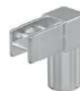
Q.02 - QUADRA Conector com 2 vias Acabamento: CR