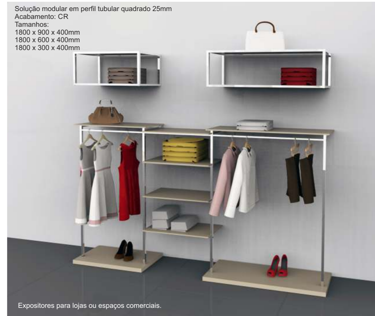
Solução modular em perfil tubular quadrado 25mm Acabamento: CR Tamanhos: 1800 x 900 x 400mm 1800 x 600 x 400mm 1800 x 300 x 400mm