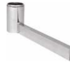
2009 Pé base «L» para coluna 2902A Comprimento: 420 mm Acabamento: CR