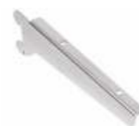
2247DX/SX - Direito/Esquerdo Suporte para prateleira Comprimento: 260 mm Acabamento: CR