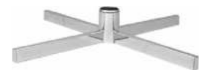
2008 Pé base «X» para coluna 2902A Comprimento: 735 mm Acabamento: CR