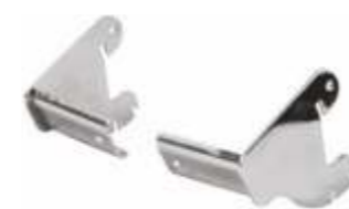
2245ADX/SX Direito/Esquerdo Suportes para tubo oval 4000L 30 x 15 mm Acabamento: CR