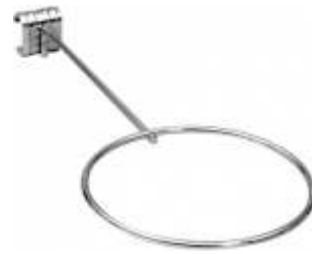
2061A Suporte para bolas para tubo oval 4000L Comprimento: 150 mm Acabamento: CR