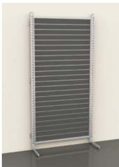
DISPLAY SYSTEM SOLO Montagem encostada à parede

solo é um sistema versátil e elegante, ideal para projectar espaços comerciais. Diferentes componentes e acessórios permitem criar soluções apelativas para espaços únicos e personalizados.