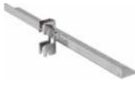
2028A Suporte central para prateleira Comprimento: 300 mm Acabamento: CR