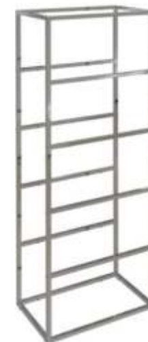
Solução modular em perfil tubular 25mm Acabamento: CR Tamanhos: 1100 x 950 x 400mm 1100 x 650 x 400mm 1100 x 350 x 400mm