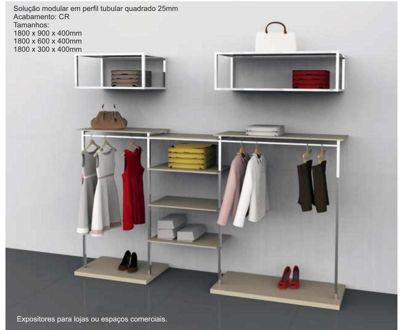
Expositores para lojas ou espaços comerciais.

Solução modular em perfil tubular quadrado 25mm Acabamento: CR Tamanhos: 1800 x 900 x 400mm 1800 x 600 x 400mm 1800 x 300 x 400mm