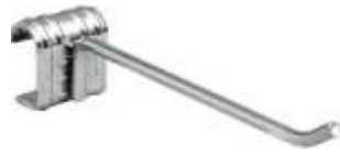
2058C Gancho simples para tubo oval 4000L Comprimento: 200 mm Acabamento: CR