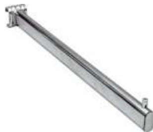
2054B Suporte simples para tubo oval 4000L Comprimento: 400 mm Acabamento: CR