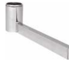
2009 Pé base «L» para coluna 2902A Comprimento: 420 mm Acabamento: CR