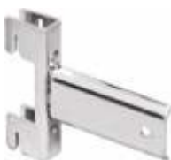
2103A Suporte para tubo oval 4000L 30 x 15 mm Acabamento: CR