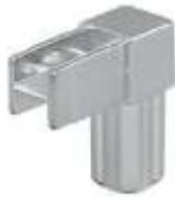
Q.02 - QUADRA Conector com 2 vias Acabamento: CR