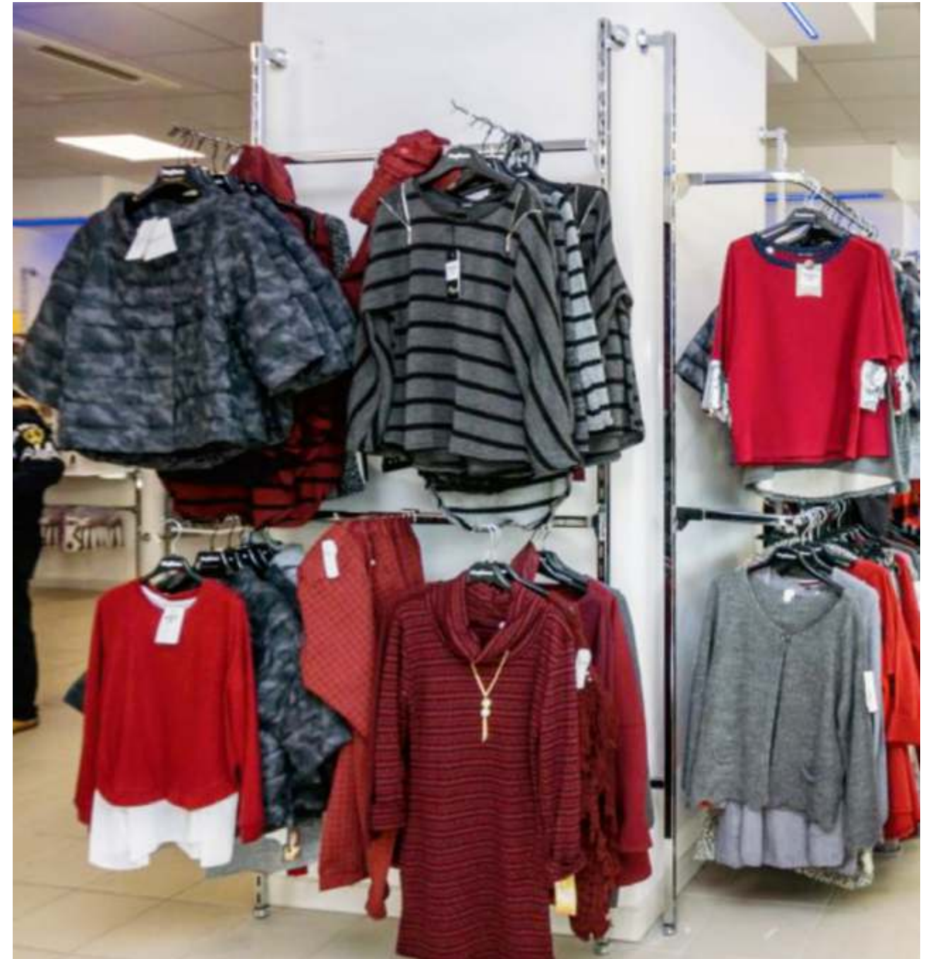
Expositores de parede mini-solo - elementos tubulares quadrados com 2200mm por 25mm / 30mm

O sistema solo está disponível em cromado, podendo ser complementado com painéis de vários tipos e cores (sistema linea, paralelo ou lisos), assim como prateleiras de madeira ou vidro.