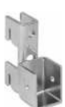
2026A Suporte para painéis com espessura de 19 mm Acabamento: CR