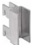
2023A Suporte para painéis com espessura 19 mm Acabamento: CR