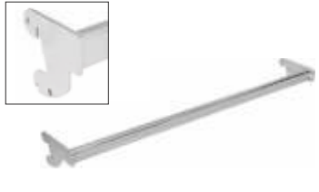
2246A Suporte em tubo para pendurados aderido Comprimento: 900 mm Acabamento: CR