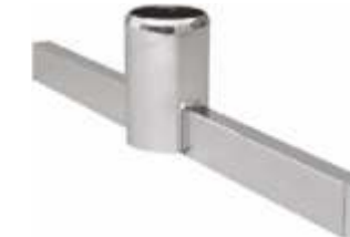
2007B Pé base «T» para coluna 2902A Comprimento: 480 mm Acabamento: CR