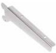
2247DX/SX - Direito/Esquerdo Suporte para prateleira Comprimento: 260 mm Acabamento: CR