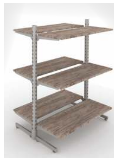
DISPLAY SYSTEM SOLO Gôndola central

O sistema solo está disponível em cromado, podendo ser complementado com painéis de vários tipos e cores (sistema linea, paralelo ou lisos), assim como prateleiras de madeira ou vidro.