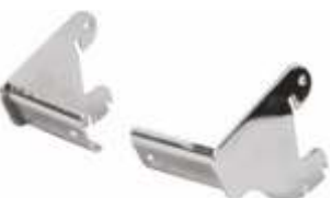
2245ADX/SX Direito/Esquerdo Suportes para tubo oval 4000L 30 x 15 mm Acabamento: CR