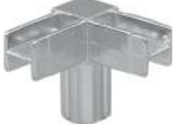
Q.03 - QUADRA Conector com 3 vias Acabamento: CR