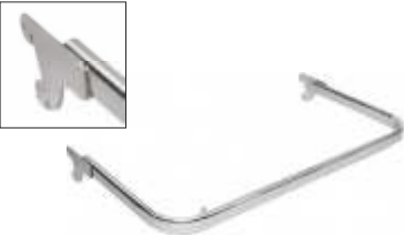
2240A Suporte em tubo para pendurados Comprimento: 900 mm Acabamento: CR