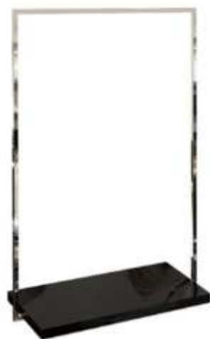
Estrutura tubular quadrada 25mm para exposição central. Acabamento: CR Tamanhos: 1450 x 650mm 1450 x 950mm

Solução modular em perfil tubular quadrado 25mm Acabamento: CR Tamanhos: 1800 x 900 x 400mm 1800 x 600 x 400mm 1800 x 300 x 400mm