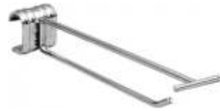
2059B Gancho simples com porta etiqueta para tubo oval 4000L Comprimento: 200 mm Acabamento: CR