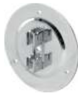
2104A Fixador parede Diâmetro: 120 mm Acabamento: CR