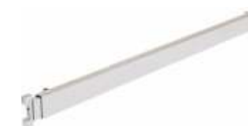
2116B Travessa rectangular telescópica em tubo 40 x 20 mm Comprimento: de 845 ate 1065 mm Acabamento: CR