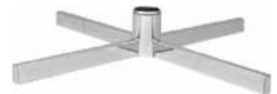
2008 Pé base «X» para coluna 2902A Comprimento: 735 mm Acabamento: CR