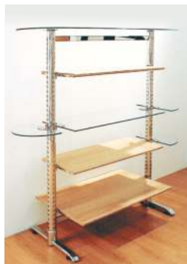
DISPLAY SYSTEM SOLO Gôndola central