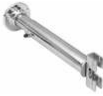
2045A Fixador parede telescópico Comprimento: de 180 ate 290 mm Diâmetro: 28 mm Acabamento: CR