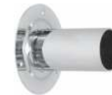
2108 Fixador para parede para 2109 Diâmetro: interior 55 mm / exterior 120 mm Acabamento: CR