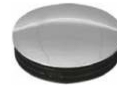
2041 Topo de coluna Diâmetro: 60 mm Acabamento: CR