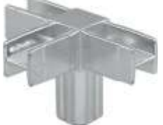
Q.04 - QUADRA Conector com 4 vias Acabamento: CR