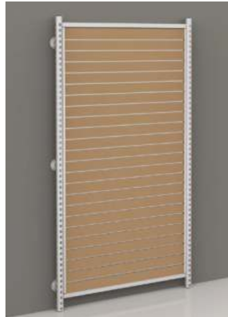
DISPLAY SYSTEM SOLO Montagem com fixação encostada à parede

solo é um sistema versátil e elegante, ideal para projectar espaços comerciais. Diferentes componentes e acessórios permitem criar soluções apelativas para espaços únicos e personalizados.