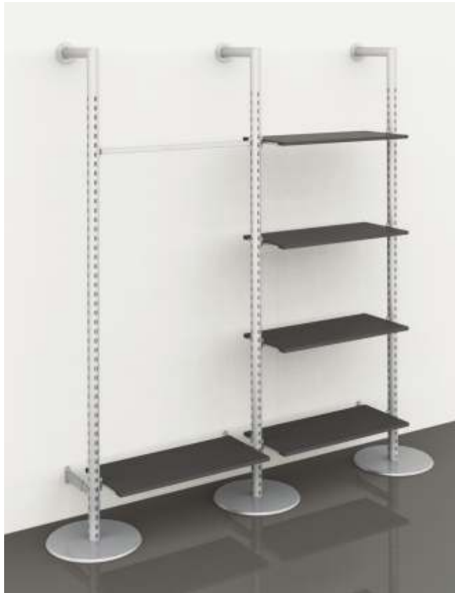
DISPLAY SYSTEM SOLO Montagem com fixação afastada da parede