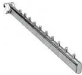
2055B Suporte inclinado com pontos para tubo oval 4000L Comprimento: 400 mm Acabamento: CR