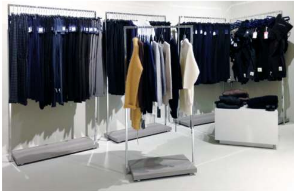
Expositores centrais para lojas ou espaços comerciais.