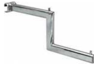
2057B Suporte «Escada» para tubo oval 4000L Comprimento: 400 mm Acabamento: CR