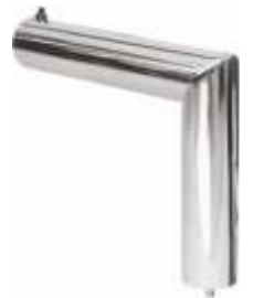
2109 Fixador parede superior para coluna 2902A Diâmetro: 60 mm Acabamento: CR