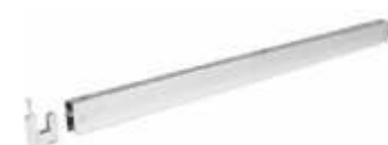
2082A Travessa rectangular em tubo 40 x 20 mm Comprimento: 936 mm Acabamento: CR