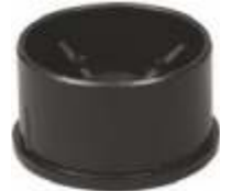
2020 Pé de encaixe Diâmetro: 60 mm