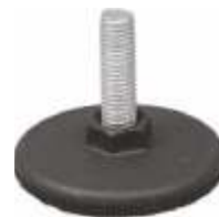
2021 Pé nivelador Diâmetro: 60 mm