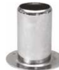
2022 Fixador para piso Diâmetro: interior 70 mm / exterior 120 mm Acabamento: CR