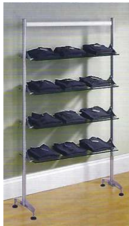
Gôndola central / Dupla Face